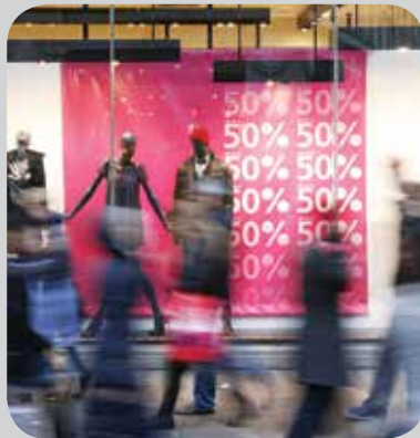
Säljdisplayer i butiker