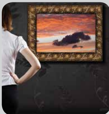
Högkvalitativa utskrifter och affischer